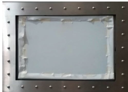
700X500 Vista dall'acqua