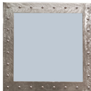
Ø 600, Vista dall'esterno